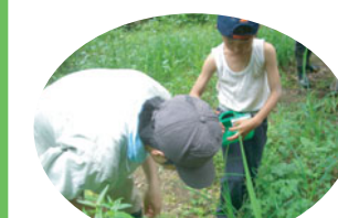
「先生、これは何ですか?」