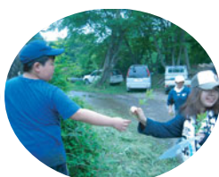
「はい、お姉ちゃんの分!」