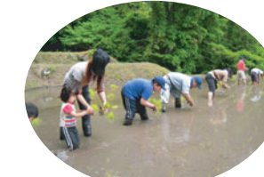
一列に並んで、きれいに植えました。