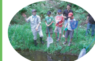
ピオトープには何がいるかな?