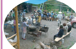
みんなで食べると おいしさ倍増です。