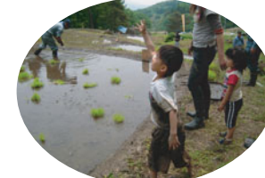
苗を田んぼに投入!