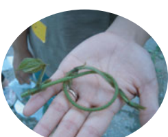
クズはくると巻いて 揚げるとおしゃれです。