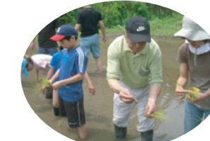
だんだんの会のメンバーに教わりながら、田植えに挑戦。