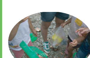
最後にみんなで復習です。 「こんなのかいたよ」