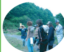
熱心に先生の説明を 聞いています。