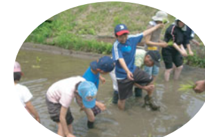
「おとっと」 転ばないように気をつけて!