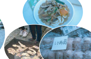
おいしい物がたくさん! お腹いっぱいいただきました。