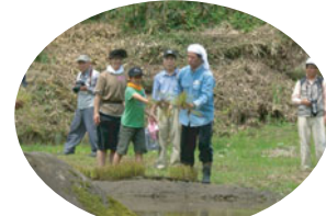
苗の準備。今回は5種類赤米、青米、緑米、紫米、黒米の苗を植えました。