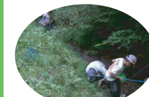
沢にも入って探してみよう!