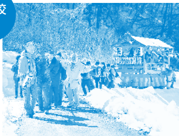
春よ来い/反町 維吹