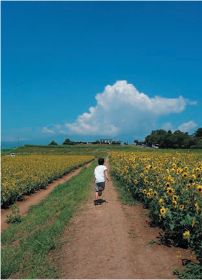
撮影地：山梨県北杜市