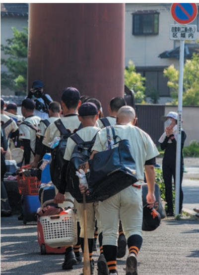
撮影地：群馬県前橋市