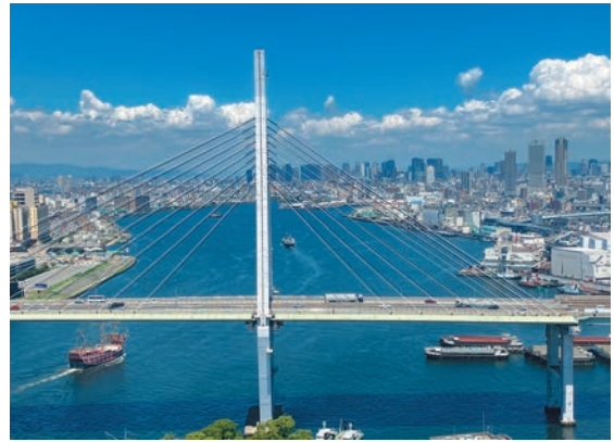
撮影地：大阪府大阪市