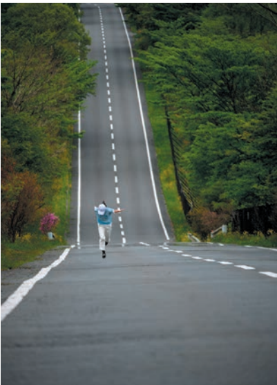
撮影地：山梨県富士川町