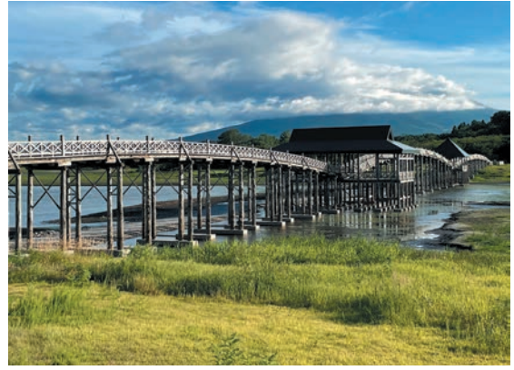
撮影地：青森県鶴田町