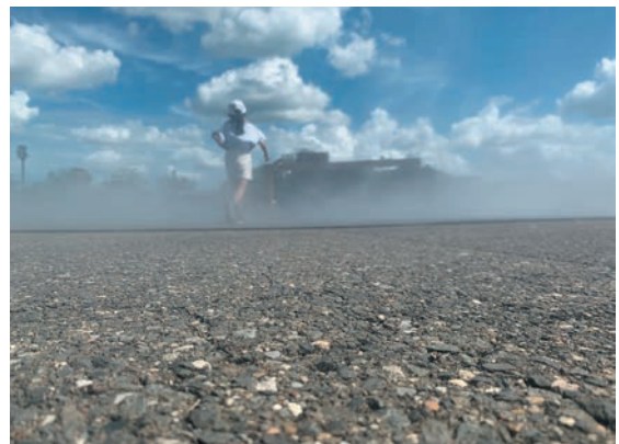
撮影地：栃木県芳賀郡茂木町