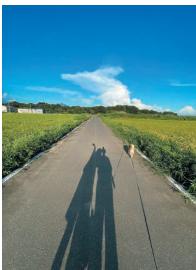
変わらないもの わたなべ ゆいな 渡邊 結菜