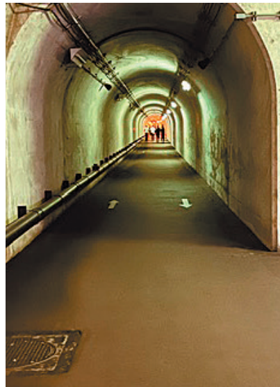
撮影地：新潟県十日町市