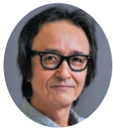
写真家 加藤 雅昭

今年は新型コロナがインフルエンザと同じ5類に引き下げられ、夏祭りや花火大会などのイベントも完全復活しました。昨年のこの写真コンクールでは行動制限撤廃で解放感を感じさせる作品が多数寄せられたのですが、今年は昨年以上にエネルギーに満ち喜びを爆発させるかのような作品が数多く寄せられました。その中でも特に印象的だったのは低学年ほど感情をストレートに表現した力強い作品が多かったことです。技術面ではやや粗削りですが、素直な気持ちで被写体と接していることが作品からも判ります。最新鋭のスマートフォンでは写真技術の習得がほぼ不要で撮影だけに集中することが可能となり、これらの力強い作品は「スマートフォンならではの新たな表現方法」で生まれたのかもしれない。