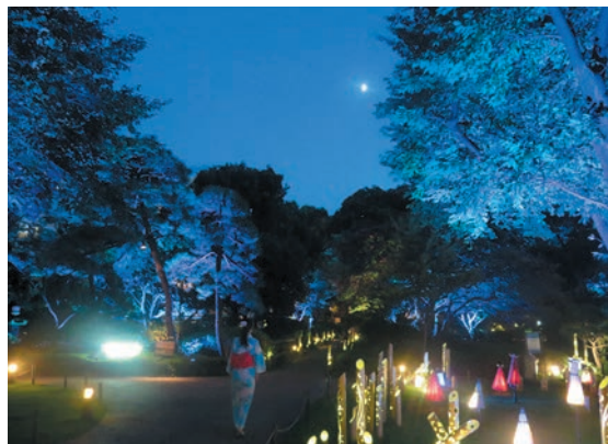
撮影地：東京都港区