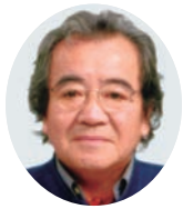
写真家 木村 恵一

2023年夏は日本の気象庁観測史上最も暑い日が続きました。11月になっても半袖姿の日がありましたが、これは日本だけではなく世界的なものだったようで国連事務総長は「地球の温暖化ではなくもはや地球沸騰（ふっとう）化の時代がやってきた」と表現しました。ここ数年はコロナウイルスに悩まされたあとだけに皆さんもご苦労されたと思いますが、それでも今年も例年同様多くの優れた作品が寄せられました。近年ではスマホで映像表現することがあたりまえの時代になりデジタルカメラでの撮影が少なくなってきましたが、日常持ち歩いているスマホだけに撮影する場面も多くなり被写体内容も変化してきました。今後も更に新しい視線での応募を楽しみにしています。