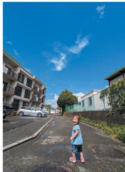
撮影地：神奈川県横浜市

おじいちゃんと 遊歩道 とおやま おうぶ 遠山 桜吹 埼玉県 さいたま市立 三室小学校 5年