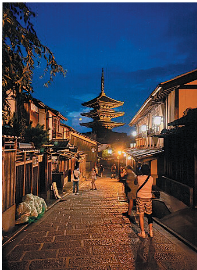
撮影地：京都府京都市