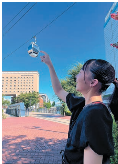
撮影地：神奈川県横浜市