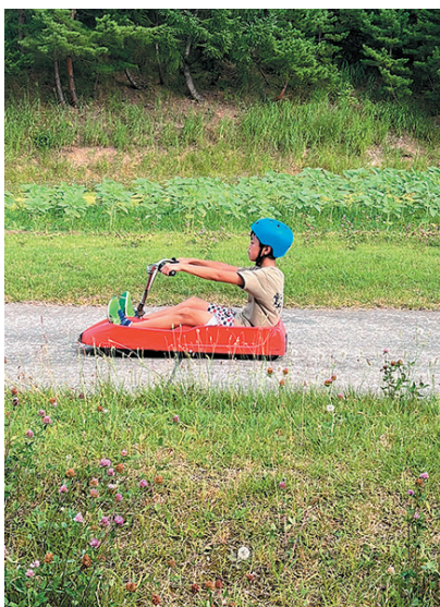
撮影地：青森県青森市

時速 60kmで スライダーで、 びびりなため、 どう見ても 止まっている ようにしか 見えない弟。