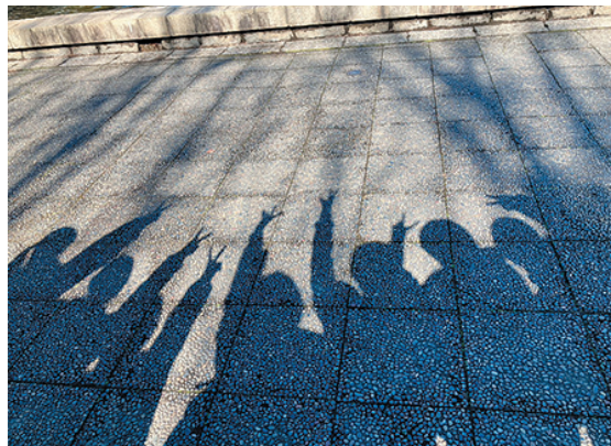
撮影地：埼玉県さいたま市（北浦和）