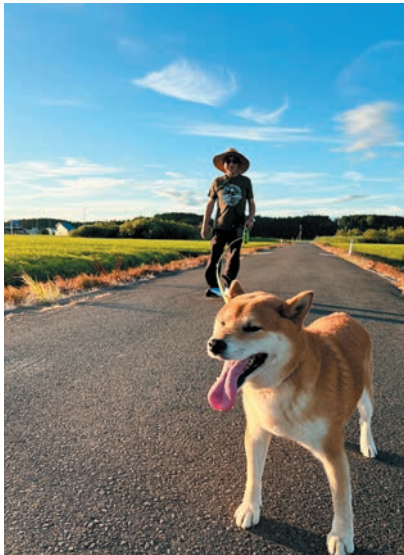
撮影地：秋田県三種町