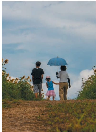
撮影地：群馬県富岡市