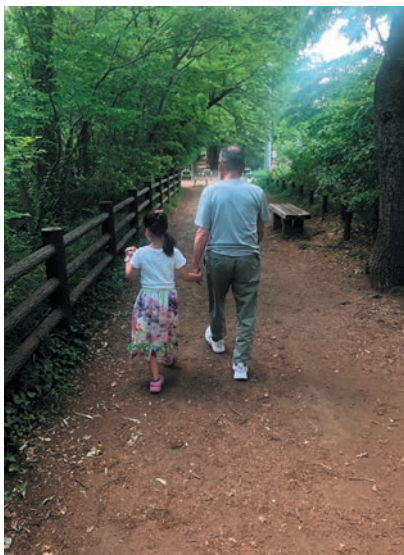
撮影地：東京都小平市

おじいちゃんと 遊歩道 とおやま おうぶ 遠山 桜吹 埼玉県 さいたま市立 三室小学校 5年