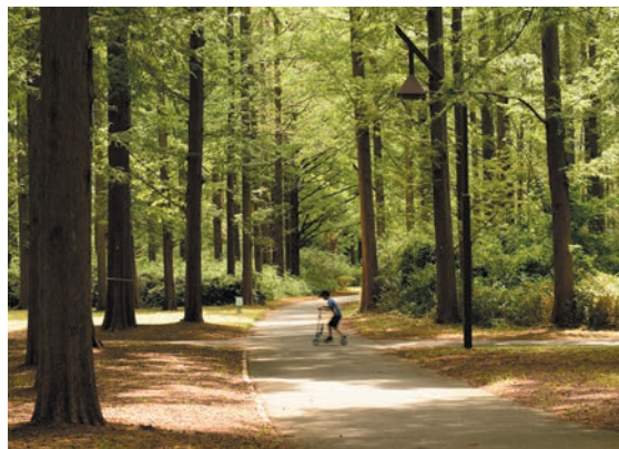
撮影地：東京都葛飾区