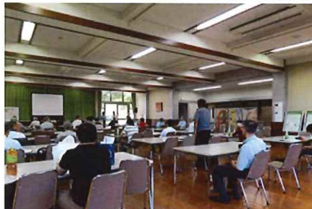
意見交換会のようす