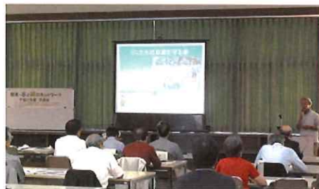
選定団体の活動紹介